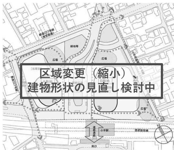
令和4年度に近隣説明会で説明した計画イメージ図

地域の皆様方には今後も定期的に事業の進捗状況をお知らせするとともに、これからも皆様のご協力もいただきながら、小平駅北口地区のまちづくりを進めてまいりたいと思いますので、よろしく願いいたします。