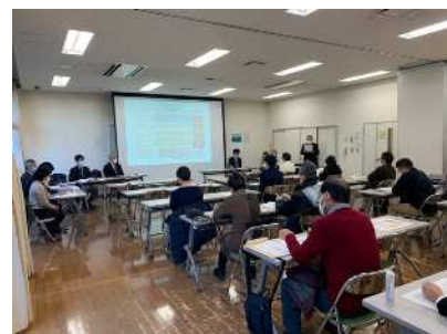
11月28日の説明会の様子

今回の説明会ではご参加された周辺の方から、東京街道の混雑緩和や歩行者の安全な通行、工事期間中の工事車両への対応等に関してご質問やご意見をいただきました。それらのご意見も参考にさせて頂きながら、今後の関係機関等との協議を進めていきたいと考えております。